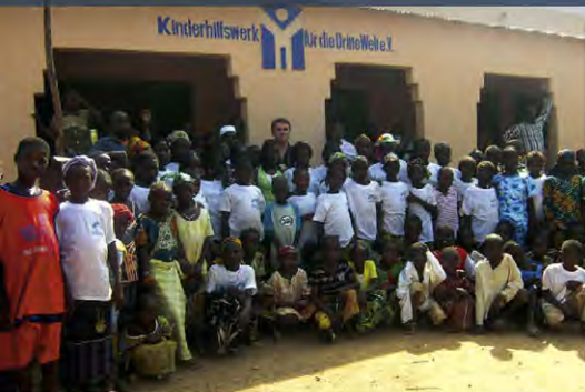
Bildung fürs Leben: Eröffnung der KHW-Schule in Dogoba/Mali 2008.