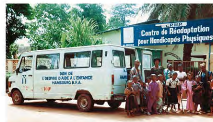
Betreuung und Schulbildung für behinderte Kinder in Malis Hauptstadt Bamako.